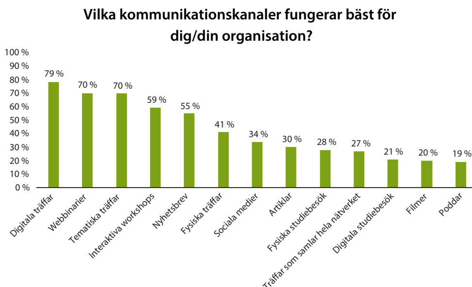
Figur 1. Landsbygdsnätverkets medlemmars svar på vilken kommunikationskanal som ”fungerar bäst” för deras organisation.

Medlemmarna fick i undersökningen ta ställning till vilken kanal som ”fungerar bäst” för deras organisation och kunde välja flera svarsalternativ. Figur 1 nedan visar resultatet.