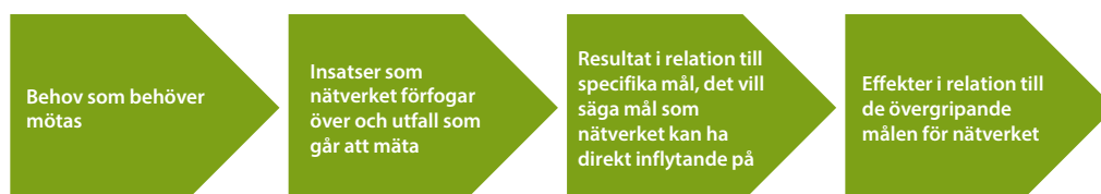
Figur 2. Logisk kedja för Landsbygdsnätverkets arbete.

I aktivitetsplanen operationaliseras Landsbygdsnätverkets övergripande mål till specifika mål för den tvååriga aktivitetsplanperioden. Genom att identifiera medlemmarnas behov formulerar styrgruppen ytterligare målsättningar (specifika mål) som relaterar till de mål som finns högre upp i målhierarkin (övergripande mål). Styrgruppen föreslår även ett antal aktiviteter eller åtgärder som genom en kedjereaktion ska leda till de uppsatta målen, både specifika och övergripande. Aktivitetsplanernas logiska kedja illustreras i figur 2 nedan.